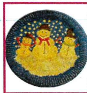
Dieses Schneemannbild hat uns aus Osttirol erreicht.

Zuerst bemalst du den Pappteller mit blauer Farbe und lässt die Farbe trocknen. Dann malst du die drei lachenden Schneemänner auf den Teller. Um den Schnee am Boden deutlicher hervorzuheben, kannst du den Teller in diesem Bereich auch mit Watte bekleben.