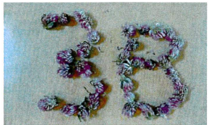
3b als Naturbild