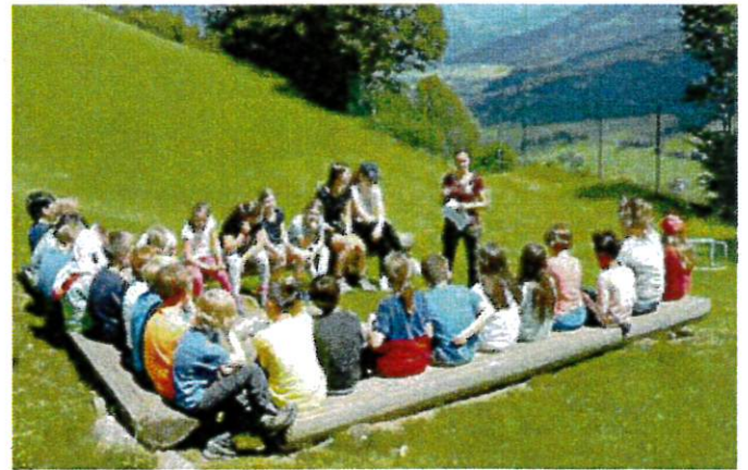
Die Münchner Kinder am Salvenberg