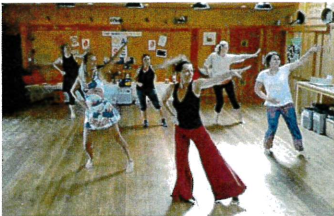
NIA - getanzte Lebensfreude

Auch wir waren begeistert von dieser jungen Gruppe, die sicher viele tolle Erinnerungen mit nach Hause genommen hat.